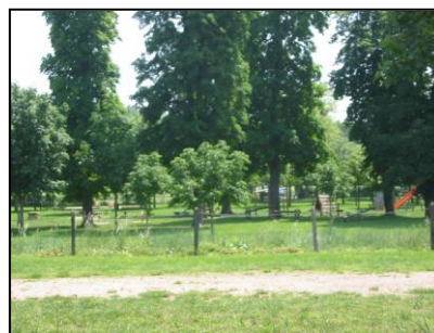
Espace de détente et de loisirs à proximité du Serein