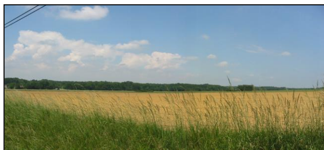
Points de vues ouverts sur le paysage agricole