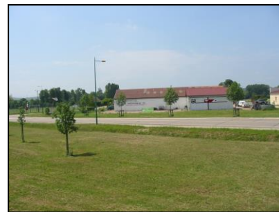
Qualité de l'aménagement paysager