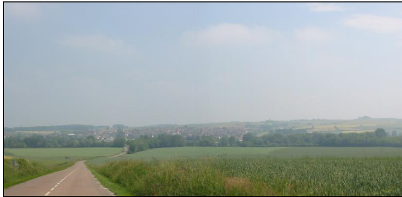
Perspectives ouvertes sur le centre ville