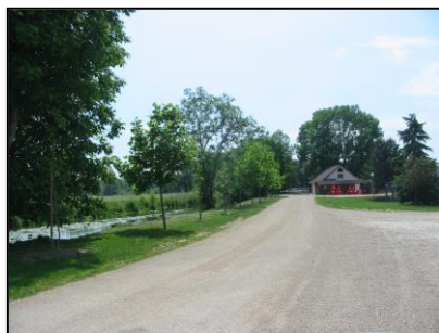
Espace de détente et de loisirs à proximité du Serein