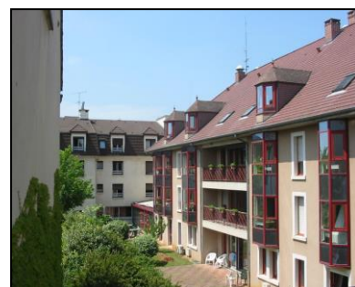
Maison de retraite médicalisée