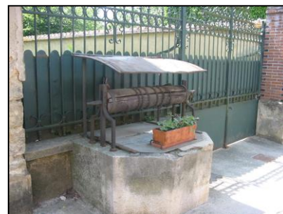
Éléments de petit patrimoine à protéger