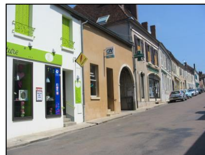
Maintien des commerces et des services