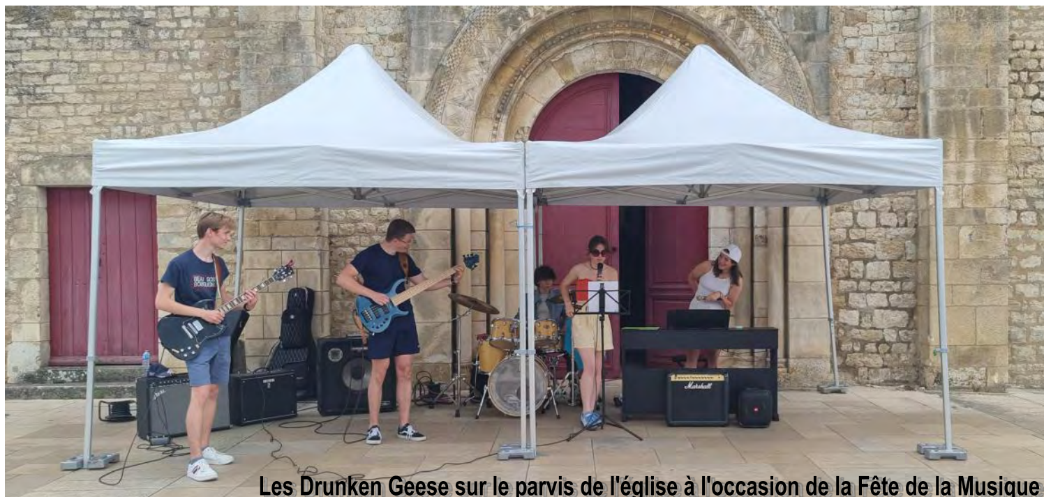
Les Drunken Geese sur le parvis de l'église à l'occasion de la Fête de la Musique

En attendant nous vous souhaitons une bonne lecture et un bon été.