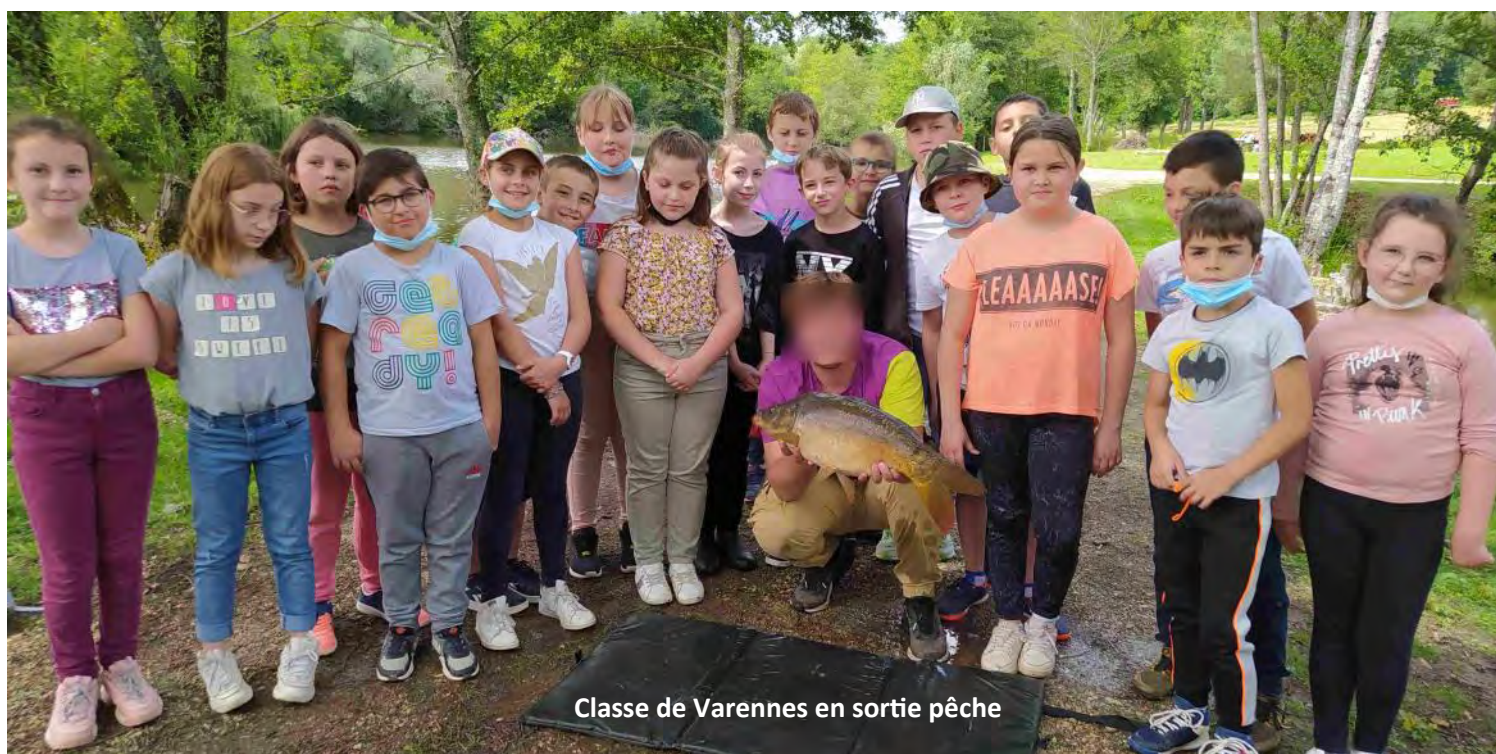
Classe de Varennes en sortie pêche

Ces sorties sont financées en partie par les crédits accordés par le SIVOS. Cela permet aux élèves de pouvoir changer d'air (encore plus appréciable en cette fin d'année particulière). Une partie est également financée par la coopérative scolaire. Nous vous souhaitons un bel été.