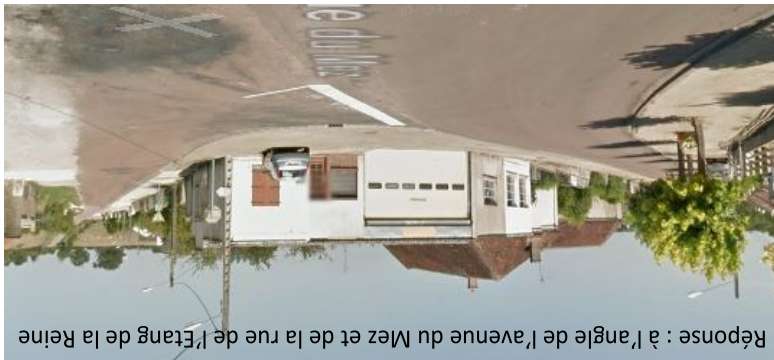
Réponse : à l'angle de l'avenue du Meiz et de la rue de l'Étang de la Reine

Notre église accueillera le concert du Chœur d'Hommes de l'Auxerrois le dimanche 16 octobre à 17 heures.