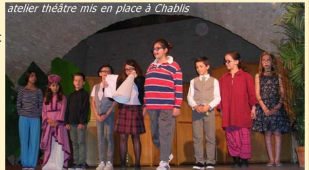
atelier théâtre mis en place à Chablis

L'objectif est d'initier les enfants au théâtre par une approche ludique et adaptée.